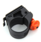
取付可能径の広い ブラケット