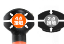
ぐらつきを抑える 4点接触クランプ