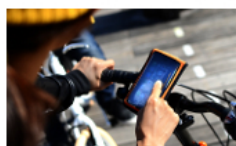
ケースに入れたまま スマートフォン操作が可能