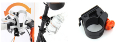
自由自在な 角度調整