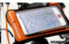
ネオプレン素材で スマートフォンを守る