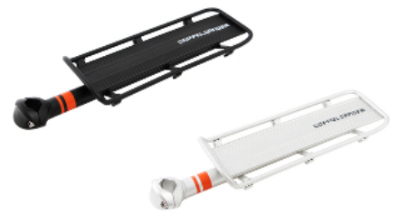
ラゲッジキャリア DLC192-BK / DLC192-SL