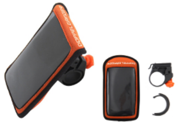
スマートフォンケース DPC197-OR