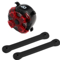
コンパクト2in1LEDライト DLS182-BK

DOPPELGÄNGER® SHOCK THE PEOPLE ベルの音は「クワカク」