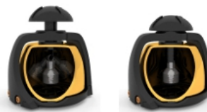
上部のミュートボタンで 接近音のオンオフ切り替え可能