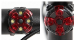
←カバーを回転させ 白色/赤色の発色を選択可能