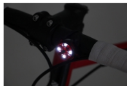
ハンドルバーに取り付けて フロントライトとして