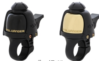
ヴァイスベル DBB181-BK / DBB181-GL