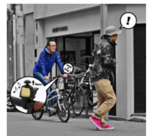
他者へ自身の接近を 軽やかな鈴音でお知らせ

【商品名】 コンパクト2in1LEDライト DLS182-BK 【カラー】 ブラック 【希望小売価格】 1,400円+税 【発売開始時期】 2014年7月 【製品ページ】 http://www.doppelganger.jp/option/dls182/