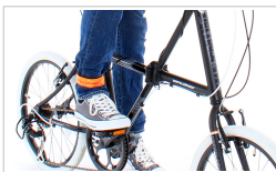
後続車のライトを反射

DRF152S-BL/DRF152S-WH/DRF153L-BL/DRF153L-WH(上から順に)