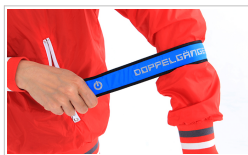
ワンタッチ巻きつけ