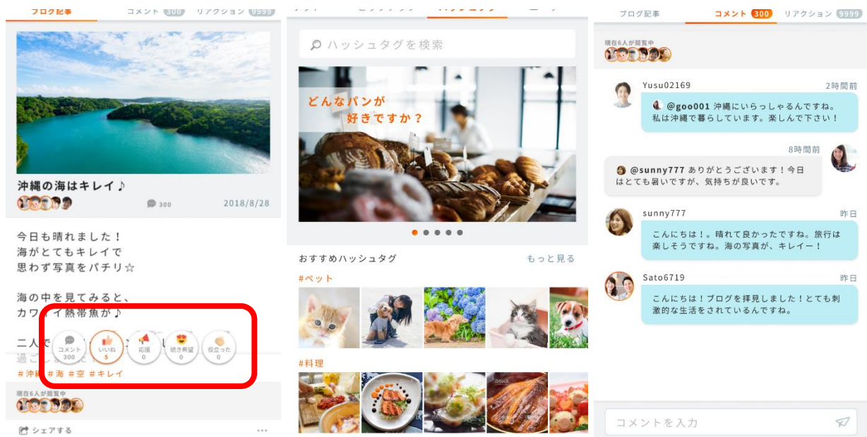
左：リアクションボタン(赤枠) 真ん中：ハッシュタグ 右：コメント欄 ※イメージ

これまで提供していたブログのコメント欄を、見やすく使いやすいデザインに変更しました。コメントのリアルタイム表示や、チャット風の画面デザインにより、視覚的にわかりやすく、気軽にコメントできるようになります。