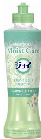
カモミールオアシスの香り