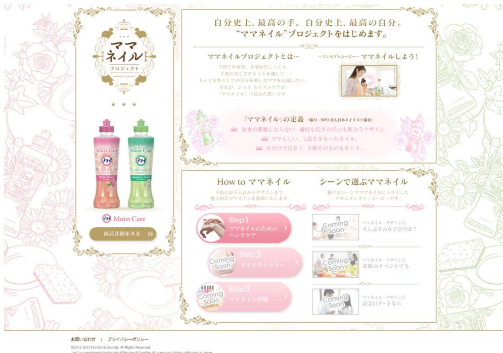
※WEB サイト TOP イメージ