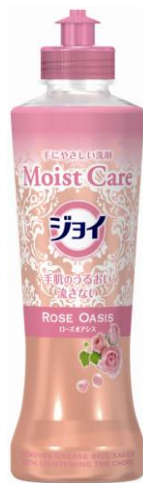
ローズオアシスの香り