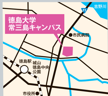
徳島大学常三島キャンパス案内図

※駐車場は限りがありますので、周辺の コインパーキングや公共交通機関を ご利用ください。