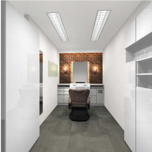
男性サロンブース(テーマ:赤レンガ)