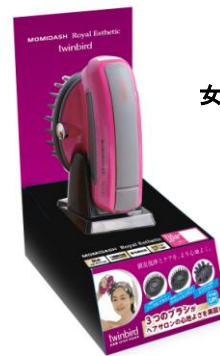
女性向け成約特典 「モミダッシュ」