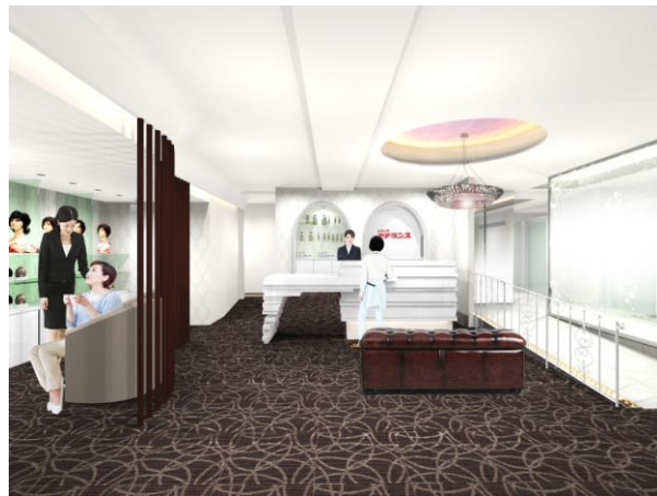
左:男性サロン「アデランス横浜」 右:女性サロン「レディスアデランス横浜」(イメージ図)