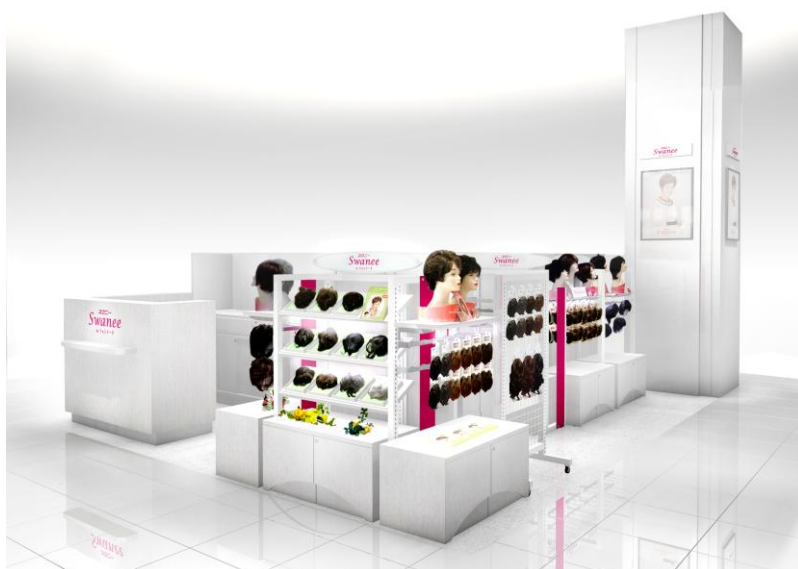
スワニーby フォンテーヌ イオン太田店 店舗

スワニーby フォンテーヌ イオン太田店は、2012年10月に初出店したイオン成田店から数えて、10番目の店舗としてオープンいたします。