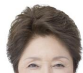
前髪を立ち上げても 自然な生え際