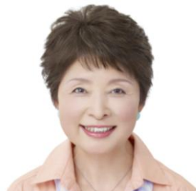
新「なじませフロント」