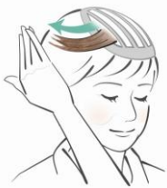
自分の髪を引き出します。