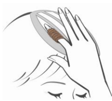
スリットに指を入れ

新「なじませフロント」は、ベースラインの改良により、頭皮にも自髪にも優しくフィットする特殊製法を採用。ご自身の髪と見分けがつかないほど自然な生え際を実現しています。