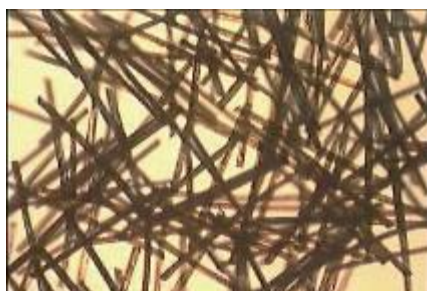
光触媒「センサーヘア」