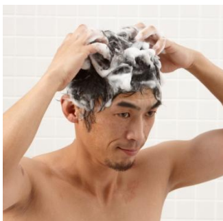
シャンプーや乾燥も 自髪感覚