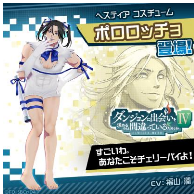
ポロロッコ (CV: 福山 潤)