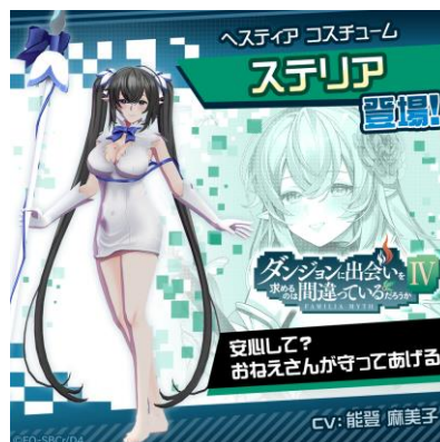
ステリア (CV: 能登 麻美子)