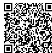
応募用 QR コード

ハガキの場合は、氏名、住所、電話番号をご記入のうえ、下記送付先にお送りいただけます。