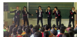
ボランティア活動する Sugar Style Spirit

「3.11東日本大震災・心に刻む集い 宿泊案内送付希望」明記の上、 ①送付先住所 ②電話番号 ③代表者氏名をご記入いただき FAX: 022-263-6693 JTB東北法人営業仙台支店 金津・佐藤宛て お送り下さい。