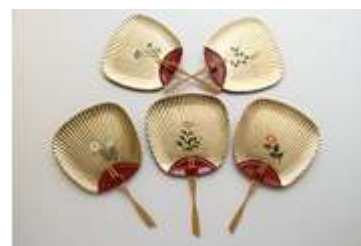
前回グランプリ受賞商品