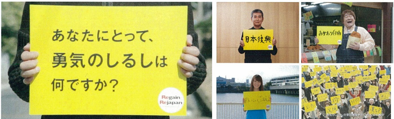
【新TV-CM リゲイン「リジャパン 勇気のしるし」篇より】