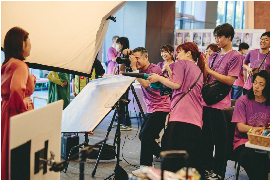
<2025年に実施した MAKEUP & PHOTOS WITH SMILESの様子>