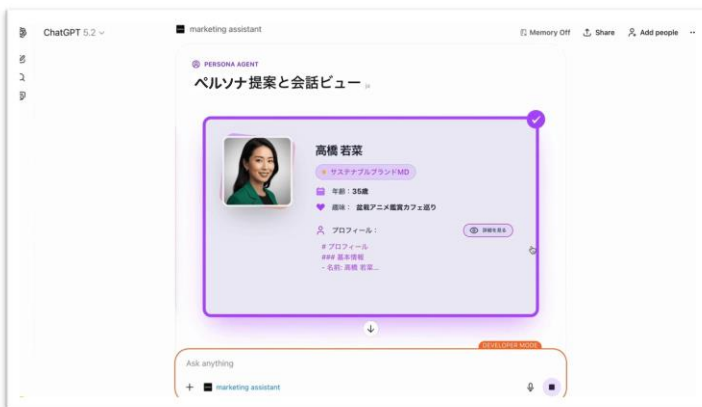
チャット内にPERSONA AGENTが立ち上がります

今後も当社グループは、独自の視点と先進的なアプローチを強みに、「人間の知」と「AI の知」を掛け合わせることで、企業の事業成長と社会の持続的な発展に貢献していきます。