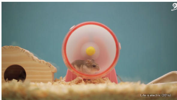
パナソニック 「Life is Electric」 （2016年デザイン部門 グランプリ受賞）

株式会社電通（本社：東京都港区、社長：五十嵐 博）は、世界最大のクリエイティブ祭典である「カンヌライオンズ 国際クリエイティビティ・フェスティバル」※ 1 （Cannes Lions International Festival of Creativity 2020）の「ライオンズライブ」※ 2 （Lions Live、期間：6月22～26日）で発表された「ライオンズ・クリエイティビティ・レポート・オブ・ザ・デケイド」（Lions Creativity Report of the Decade）において「リージョナル・エージェンシー・オブ・ザ・デケイド（アジア）」（Cannes Lions Regional Agency of the Decade – Asia）を受賞しました。