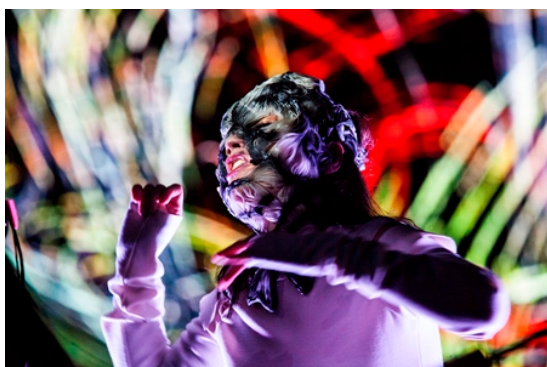
Making of Bjork Digital