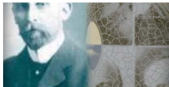
Brian Eno's The Ship-A Generative Film © Opal Limited 2016