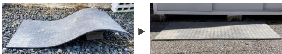
写真:(左)凹凸面で使用、(右)約 1 日で復元(自社試験)。

当社は生活資材や産業資材など、さまざまな分野で環境対応製品を開発・販売しています。今後よりリサイクルに取り組み、持続可能な社会の実現に貢献する製品の開発を進めていきます。