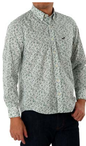
桜フレグランスチェックシャツ 1601-51112 ¥8,000+税 カラー／レッド、グリーン サイズ／M・L

ネオンカラー風の明るいチェック柄のシャツ。 一枚着としてもインナー使いとしても映える色合いです。 ※日本製の生地を使用しています。