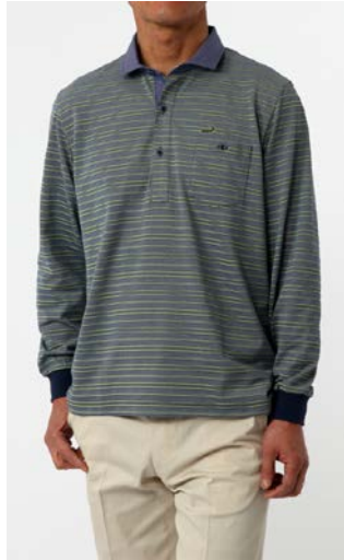
桜フレグランスボーダーポロシャツ 1602-51217 ¥8,000+税 カラー／ネイビーブルー、チャコール、グリーン サイズ／M・L・LL 落ち着いたボーダー柄に美しい型の布帛衿を施した ポロシャツ。サラッとした素材を使用し、着心地の良 さを実感できるアイテムです。 ※日本製の生地を使用しています。