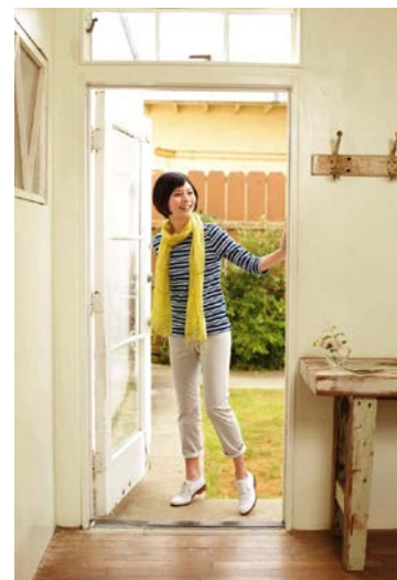
スイッチモーション