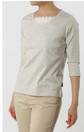
桜フレグランスプリントTシャツ 2002-51226 ¥5,000+税 カラー／ライトグレー、サックス サイズ／M・L・LL

凹凸のある意匠糸を織り込んだ、表面感のある Tシャツ。イレギュラーボーダーでマリニイメージ を表現しています。