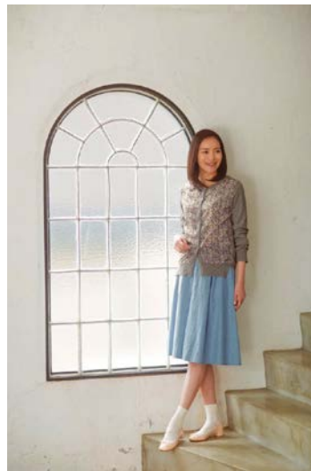
クロコダイルレディス