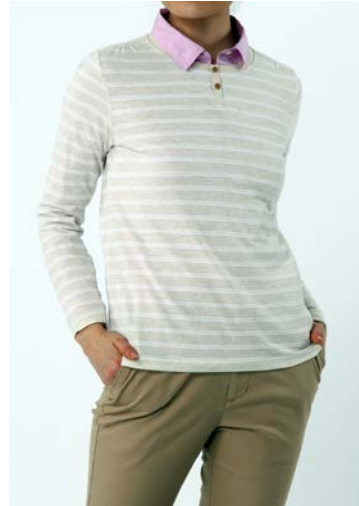
桜フレグランスジャカードTシャツ 0302-51209 ¥5,000+税 カラー／ベージュ、レッド、ブルー サイズ／M・L・LL ジャカード編みのボーダーで、春らしく 柔らかい配色にしています。 ミニヘンリーネックもポイントです。