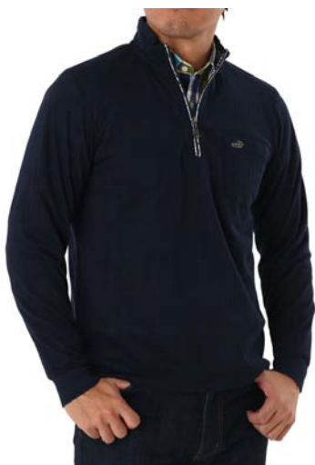
桜フレグランス ZIP ポロシャツ 1602-51215 ¥8,000+税 カラー／ホワイト、ネイビーブルー、ピンク サイズ／M・L

小花プリントのボタンダウンシャツ。淡く綺麗な カラーが、春を感じさせてくれます。 ※日本製の生地を使用しています。