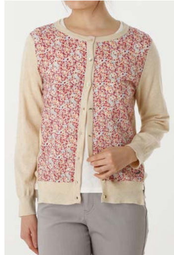
桜フレグランス花プリントカーディガン 0303-51309 ¥8,000+税 カラー／レッド、ブルー サイズ／M・L

波形が特徴的なボーダーTシャツ。 とても柔らかな素材で心地良く着こなせます。 小さな胸ポケットがデザインポイントです。