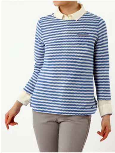
桜フレグランスボーダーTシャツ 0302-51210 ¥6,000+税 カラー／ブルー、イエロー、レッド サイズ／M・L・LL

波形が特徴的なボーダーTシャツ。 とても柔らかな素材で心地良く着こなせます。 小さな胸ポケットがデザインポイントです。