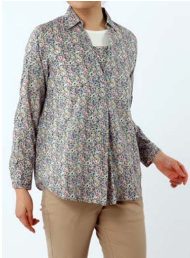
桜フレグランス花プリントシャツ 0301-51103 ¥7,000+税 カラー／レッド、ブルー サイズ／M・L・LL デザイン性に富んだブルオーバータイプのシャツ。 レーヨン混のしなやかな素材で、着心地が良く、 ラフに着こなしていただけます。