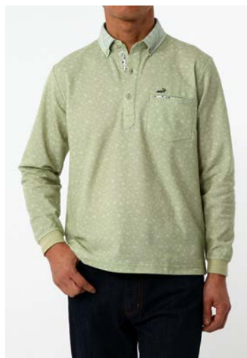
桜フレグランス小花プリントポロシャツ 1602-51216 ¥8,000+税 カラー／アイボリー、ネイビーブルー、ライトグリーン サイズ／M・L

無地スタンドジップ。インナーに T シャツ、シャツをコー ディネイトできます。 ※日本製の生地を使用しています。