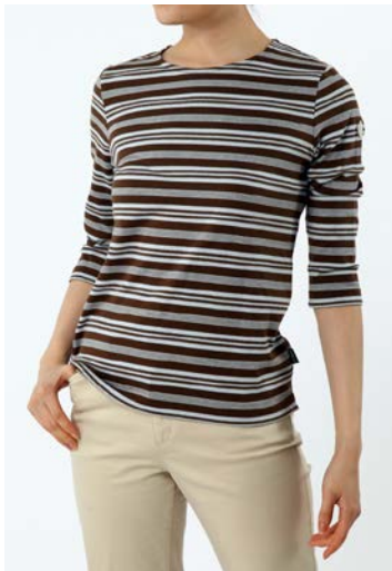
桜フレグランスボーダーTシャツ 2002-51225 ¥5,000+税 カラー／ネイビーブルー、ブラウン サイズ／M・L・LL

凹凸のある意匠糸を織り込んだ、表面感のある Tシャツ。イレギュラーボーダーでマリニイメージ を表現しています。