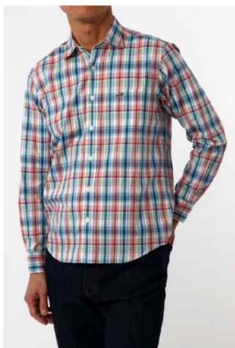
桜フレグランスチェックシャツ 1601-51111 ¥8,000+税 カラー／ブルー、グリーン サイズ／M・L

ネオンカラー風の明るいチェック柄のシャツ。 一枚着としてもインナー使いとしても映える色合いです。 ※日本製の生地を使用しています。