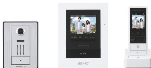
WS-24A (カメラ付玄関子機、モニター付親機、 モニター付ワイヤレス子機のセット)