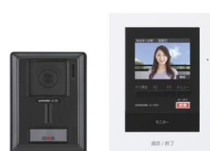
JUS-1AEK-T (カメラ付玄関子機、 モニター付親機のセット)