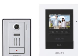
JTS-2AE-T (カメラ付玄関子機、 モニター付親機のセット)