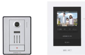
WS-24B (カメラ付玄関子機、モニター付親機のセット) ※モニター付ワイヤレス子機 (WS-2WD) は別売