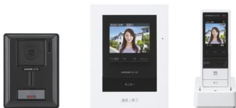
WS-14A (カメラ付玄関子機、モニター付親機、 モニター付ワイヤレス子機のセット)