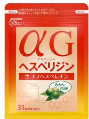
画像：「α Gヘスペリジン+ナノヘスペレチン」

※「ヘスペリジン」（ビタミンP）は、温州みかんなどの柑橘類に含まれるポリフェノールの一種であり、健康維持に役立つ成分として古くから知られています。