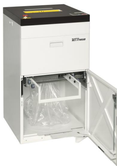
(MSX-F700SAB : 結束ハンドル)