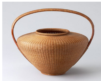
二代 田辺竹雲齋「富貴花籠」個人蔵