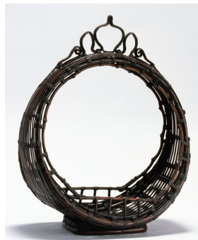
初代 前田竹房齋「鳳尾竹円窓花籠兼釣花籠」堺市蔵

本展では、堺で歴代にわたり綿々と受け継がれてきた前田家と田辺家の竹工芸をご紹介します。伝統技法を生かしつつ、新たな創作により芸術の域にまで昇華させた、竹に込められた美の息吹を感じていただければ幸いです。