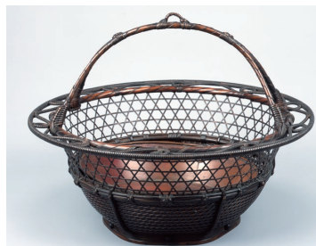
初代 田辺竹雲齋「柳里恭式釣花籠」堺市蔵