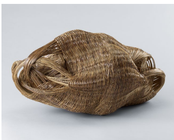
四代 田辺竹雲齋「つなかり 無限」個人蔵

竹は古来より人々の身近な素材として豊富にあり、丈夫で弾力性に富む特性から、様々な生活用具として加工されてきました。