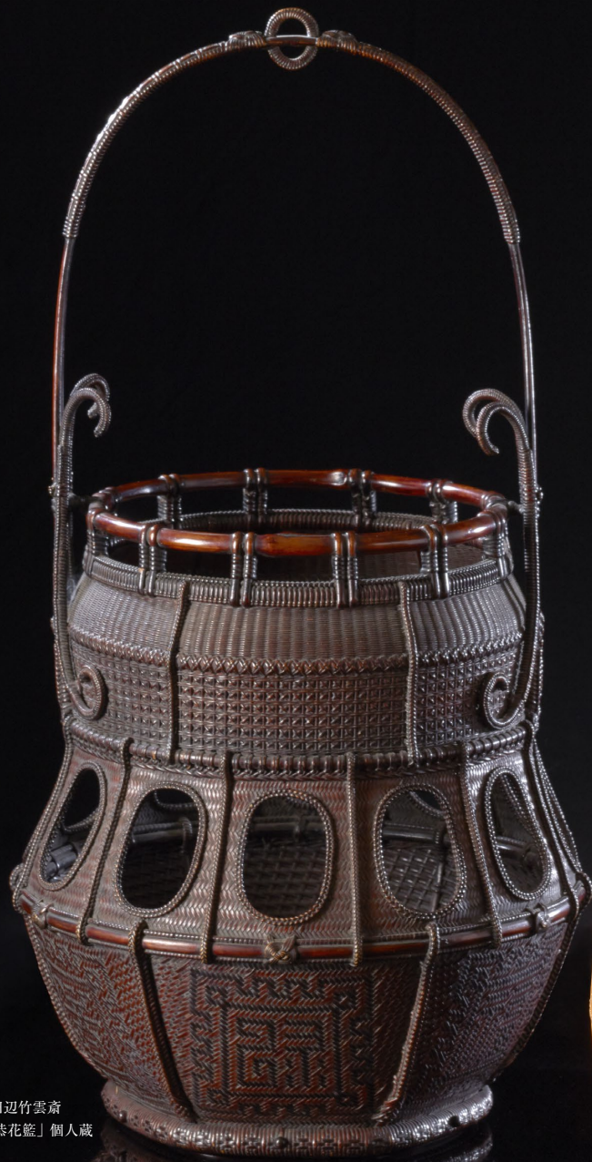
初代 田辺竹雲齋 「柳里恭花籠」個人蔵