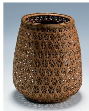
二代 前田竹房齋「七宝編花籠」堺市蔵