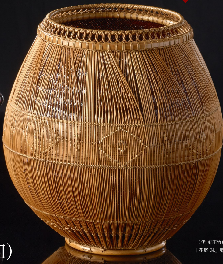
二代 前田竹房齋 「花籃 球」堺市蔵