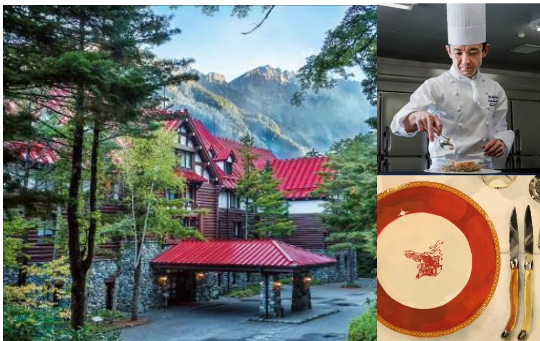
（左）上高地帝国ホテル