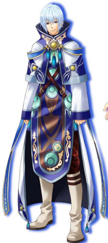
不思議系天才少年：リュカ 野島 健児