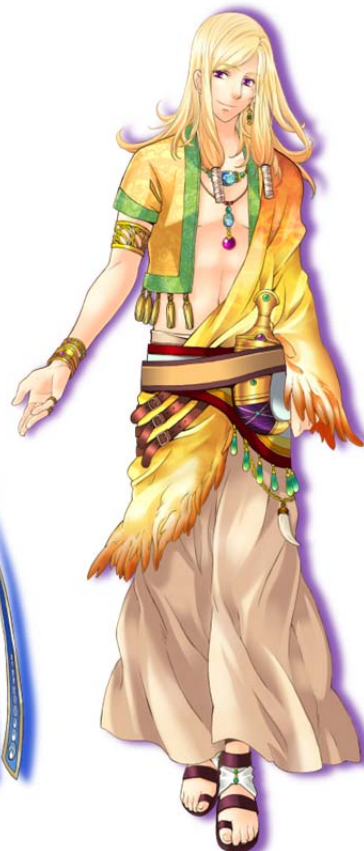
超美形ナンパ男：ス菲尔 近藤 隆