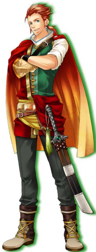
オレ様系王子：アレク役 中井 和哉