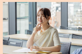
セミナーイメージ