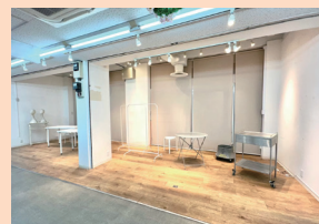
出展場所イメージ