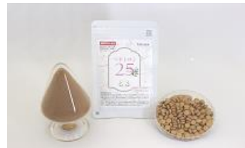
当社の原料を使用した機能性表示食品