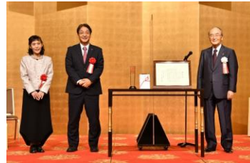
第19回顕彰式典の様子