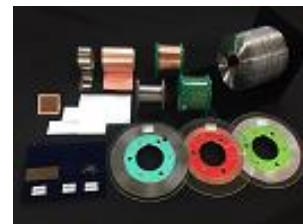
精密技術で仕上げられた製品