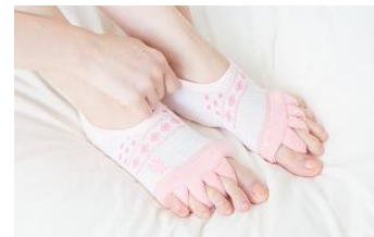
足指のリラックスアイテム