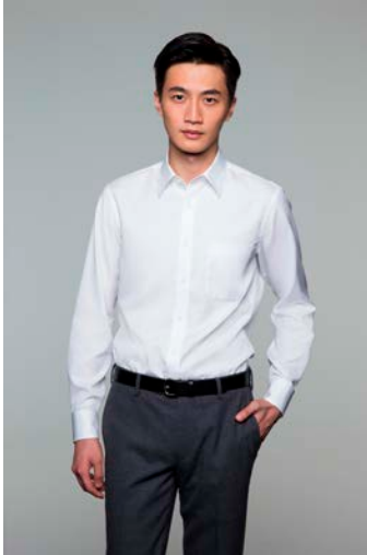
ファインクロスブロードシャツ (レギュラーフィット)