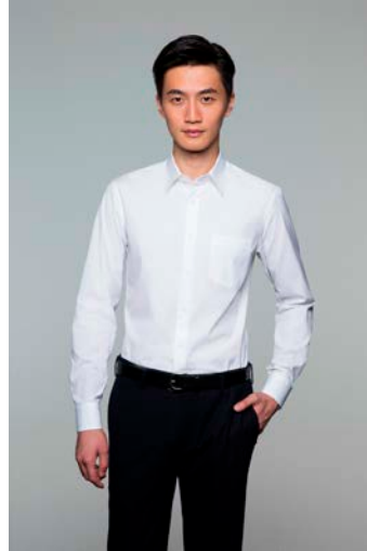
ファインクロスストレッチスリムフィット ブロードシャツ (スリムフィット)