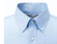
ボタンダウンタイプ襟