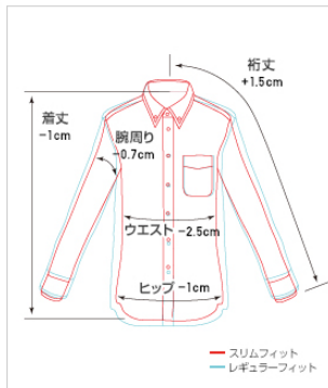
サイズ比較 レギュラーフィットと スリムフィットのサイズ比較