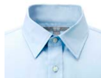
レギュラータイプ襟