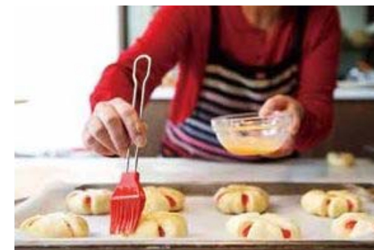
▲新鮮な素材を使って、1つずつ丁寧に焼くパンは絶品！