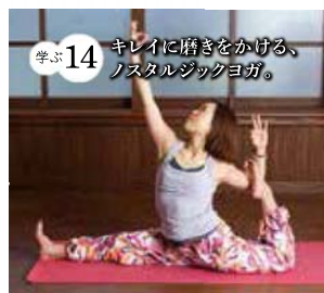
学ぶ14 キレイに膂きをかける、ノスタルジックヨガ。