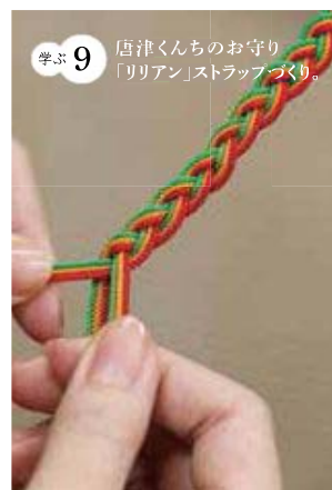
学ぶ9 店津くんちのお守り「リリアン」ストラップづくり。