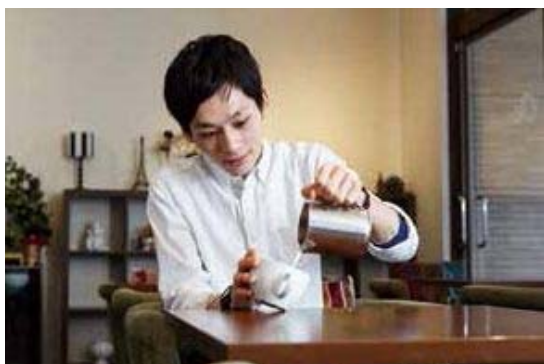
▲若くて愛嬌のあるバリスタが丁寧に教えてくれます。