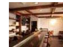
▲caffe Luna 1F内観