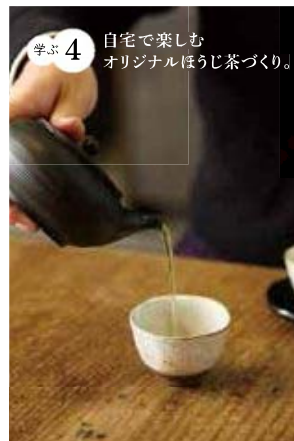
学ぶ4 自宅で楽しむオリジナルほうじ茶づくり。