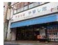
▲手芸店やました 外観

唐津くんちの時に曳子が身につけるお守り「リリアン」。唐津ではくんちに参加できない女性が、巡行中の安全祈願の想いを込めて男性にリリアンをつくることも多いのだそう。リリアンをアレンジした携帯ストラップは観光のお土産にも人気で、今回はそのリリアンストラップづくりを2代目店主から教わります。好みの色を組み合わせれば、たった一つのマイ・リリアンができますよ。くんちファンにはオススメのプログラムです。