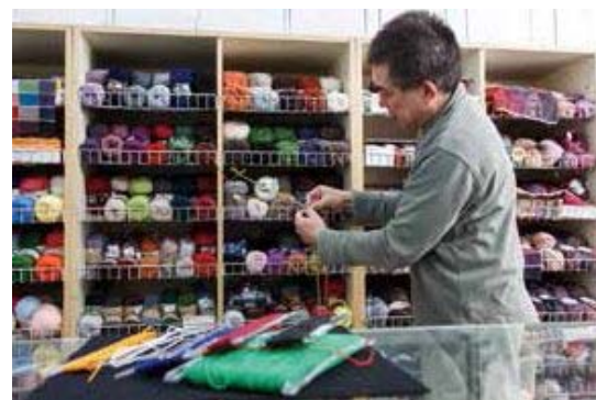
▲色とり豊かな糸を使って、世界に一つのリリアンを。