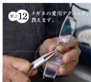
学ぶ12 メガネの愛用テクニック、教えます。