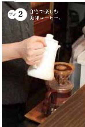
学ぶ2 自宅で楽しむ美味コーヒー。