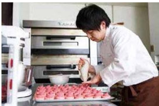
▲パティシエ直伝のケーキは、色とりも味も美味！