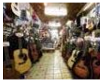
▲みきや楽器店 内観

店内には所狭しとCD、カセット、レコードが並んでおり、音楽好きにとっては知る人ぞ知るワンダーランド。定期的にギター教室や音楽ライブも開催しており、地元音楽界の兄貴的存在です。そんな音楽をこよなく愛するみきや楽器店がお届けするギターのお手入れ教室。弦の張替から音合わせ、お手入れまで、お気に入りのギターを長く使う技を伝授してくれます。お店に入ればきっと、音楽談義に花が咲くことでしょう。