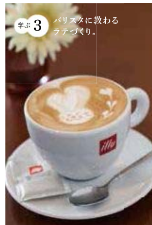
学ぶ3 バ리스タに教わるラテづくり。