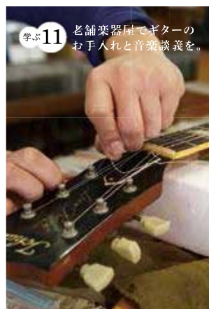
学ぶ11 老舗楽器屋でギターのお手入れと音楽談義を。