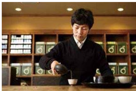
▲落ち着いた空間でお茶をいただくと、心がいやされます。