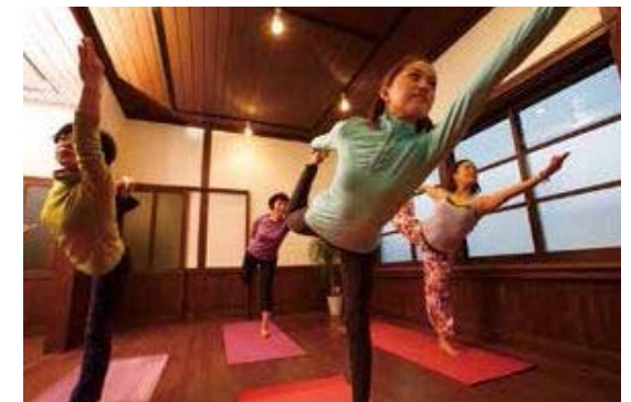
▲歴史的な佇まいの中で、キレイに磨きをかけませんか？