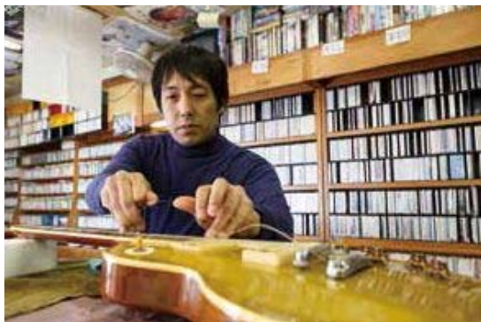
▲所狭しと音楽が並ぶ店内でギターの手ほどきを。