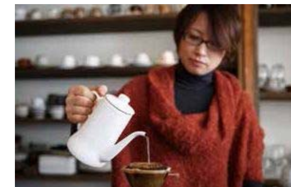
▲お気に入りの唐津焼でコーヒーが楽しめるのも魅力。

コーヒー豆にこだわり、自慢のオリジナルブレンドもつくるcaffe Luna。カフェで飲む美味しいコーヒーをおうちで再現して味わいたいと思っただけではありませんか?そんなコーヒー好きな方へお届けするのがこのプログラム。唐津の人気カフェが、おうちで簡単に美味しいコーヒーを淹れる技を伝授してくれます。最後には、淹れたてのコーヒーとスイーツでカフェタイムも楽しめます。コーヒー好きな方、お急ぎください!