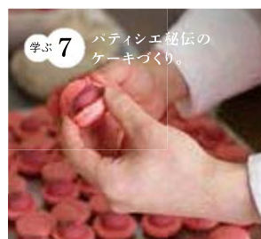
学ぶ7 ハティシエ秘伝のケーキづくり。