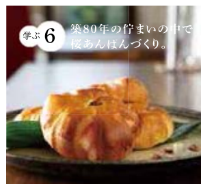
学ぶ6 築80年の竹まいの中で桜あんぱんづくり。