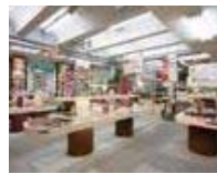
▲めがねのハシムラ 内観

メガネは単なる道具ではなく、顔の一部であり、その人を印象づけるもの。人それぞれに顔の形が違うからこそ、購入したメガネにもう一手間かけて、お顔に合わせてフィッティングするのがハシムラ流。いまのメガネが自分に合っているのか？これからどんなメガネを選んだら良いのか？正しくメガネを選び、お気に入りのメガネを長く愛用するためのお手入れテクニックを教わります。メガネコレクターの方、目から鱗です。