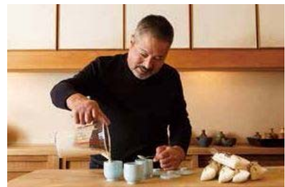
▲木のぬくもりの中で楽しむ豆腐づくり。