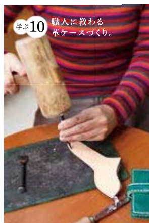
学ぶ10 職人に教わる革ケースづくり。