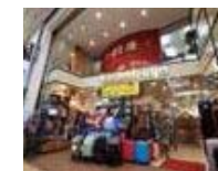
▲バッグの小松屋 外観

カバンだけでなく、多種多様な革小物が揃うバッグの小松屋さん。店内では、お客さんのオーダーを受けて革小物をつくる職人さんの姿に出会うことができます。そんな革の職人であり、笑顔が素敵な奥さんに、オリジナルの革小物の作り方を教えてもらいます。カードケースからキーケース、好きな方を選んでくれるのも嬉しい。熟練の技を習いながら、1点モノの革小物をお土産につくってはいかがでしょうか？