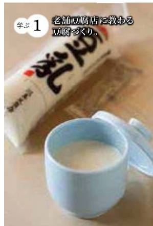
学ぶ1 老舗豆腐店に教わる豆腐づくり。