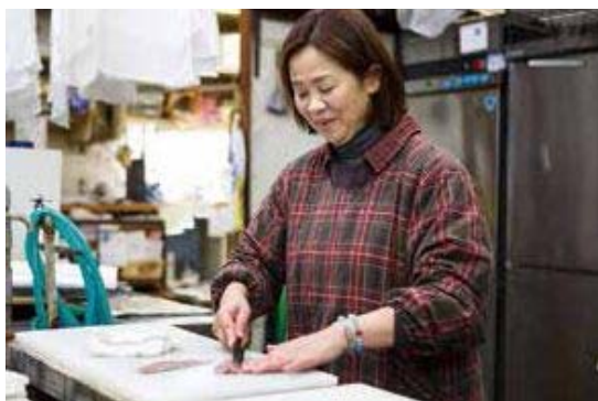
▲魚の捌き方を教わって、日常の食卓を豊かに。