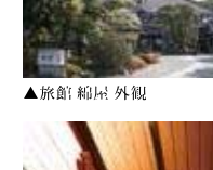
▲旅館 綿屋 外観