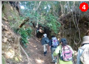
400년 역사의 길. 四百年続く道

茶苑 海月 入場料 (大人: 500円抹茶とお菓子付) 名護屋城の四季を楽しみながら、気軽に抹茶とお菓子がいただけます。