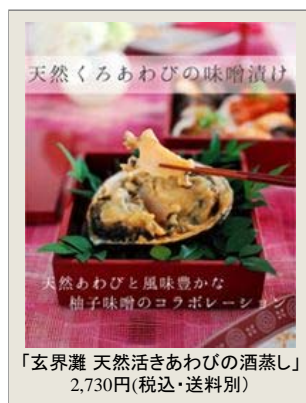
「玄界灘 天然活きあわびの酒蒸し」 2,730円(税込・送料別)

「選べる2箱セット」 十分に染み込んだ味噌の味と柚子の香りが格別な天然あわびの味噌漬けと、あっさり薄味で磯の香りとふっくら柔らかさを味わえる酒蒸しのセット