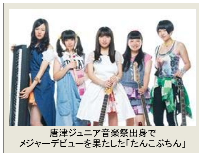
唐津ジュニア音楽祭出身で メジャーデビューを果たした「たんこぶちん」