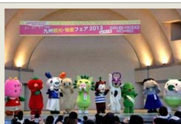
東京代々木公園に九州各県キャラクターが大集合