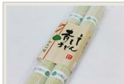
青しそうどん：1袋(100g×2束) 原材料名：小麦粉、紫蘇粉、紫蘇エキス、塩、くちなし色素

創業以来、有機肥料を使い徹底した減農薬栽培を行う青しそ(大葉)専門の生産農家「麻生園芸」。