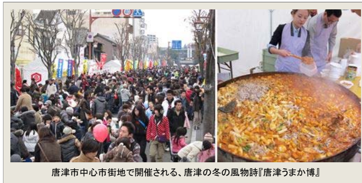
唐津市中心市街地で開催される、唐津の冬の風物詩『唐津うまか博』