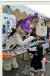
彦根でひこにゃんと唐ワンくんが共演

代々木公園では「九州観光物産フェア」が開催され、九州各県を代表するご当地キャラが集まりました。佐賀県代表として参加した唐ワンくんも東京で力の限り唐津をPRして来ました。