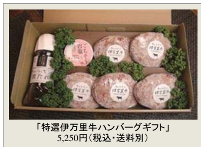
「特選伊万里牛ハンバーグギフト」 5,250円(税込・送料別)

■唐津の老舗のステーキ専門店「キャラバン」のお取り寄せの逸品 「特選伊万里牛ハンバーグギフト」