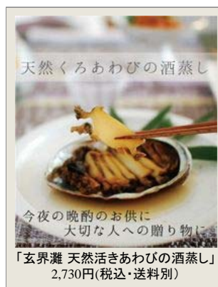
「玄界灘 天然活きあわびの酒蒸し」 2,730円(税込・送料別)

創業昭和十五年「多くの方にあわびを食していただけるよう、出来るだけ安価で努力する」という経営理念のもと、三十年にわたり玄界灘の天然あわびにこだわり続ける、あわび料理専門店「魚又」。