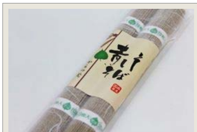
青しそそば：1袋(100g×2束) 原材料名：小麦粉、紫蘇粉、紫蘇エキス、そば粉、塩、くちなし色素