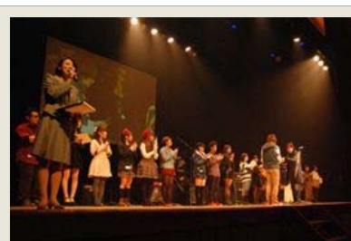
次回は、どんな才能が花開くのでしょうか？ (写真は前回大会の表彰式)

唐津ジュニア音楽祭の審査委員長・西尾芳彦氏(唐津出身)は、昨年、日本レコード大賞最優秀新人賞を受賞した家入レオ、絢香やYUIを輩出した「音楽塾ヴォイス」を主宰し、Kiroroのヴォーカル玉城千春のソロデビューをプロデュースする等、幅広く活躍する音楽プロデューサーです。