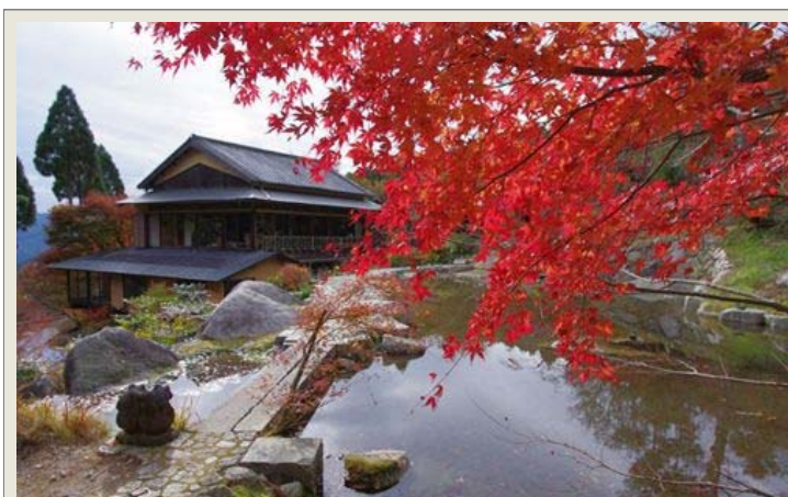
四季折々の風景が楽しめる「環境芸術の森」11月の紅葉の風景 唐津市厳木町平之 http://mori.tsurumatsu.com/

佐賀県唐津観光協会が発行するニュースレター「唐津んもんだより」第85号です。 唐津のイベント・観光情報をお届けします。