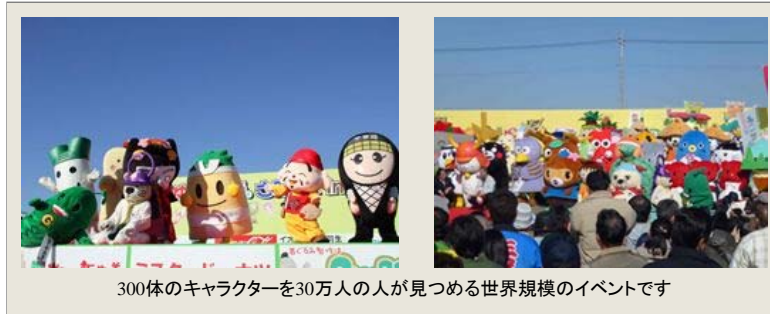
300体のキャラクターを30万人の人が見つめる世界規模のイベントです