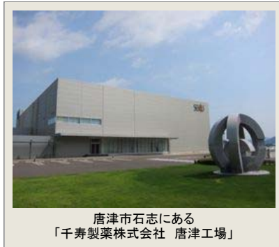
唐津市石志にある 「千寿製薬株式会社 唐津工場」