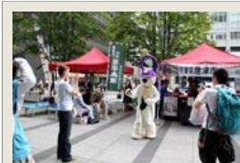
東京駅前で唐津観光PR

日中の最高気温は36度を超える日が続いてありますが、唐ワンくんは元気です。東京に出張したり、夏祭りに参加したり、唐ワンくんがデザインされたパンが発売されたり、今年の夏も日々楽しく過ごしています。 まだまだ残暑厳しい候です、どうぞご自愛くださいませ。