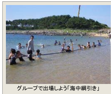
グループで出場しよう「海中綱引き」