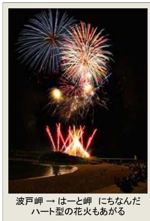
波戸岬 → はと岬 にちなんだ ハート型の花火あがる