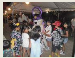
夏祭りに今年の夏は10回参加