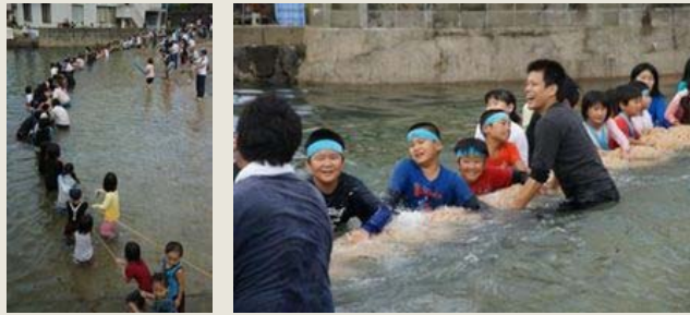
16:30からの「大人綱」の前には、16:00より「子供綱」も行われる