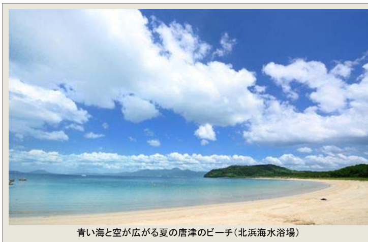
青い海と空が広がる夏の唐津のビーチ(北浜海水浴場)

佐賀県唐津観光協会が発行するニュースレター「唐津もんだより」第82号です。 唐津のイベント・観光情報をお届けします。