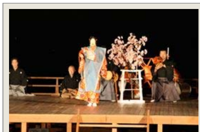
能や狂言の名だたる面々の舞を鑑賞する事ができる肥前名護屋城跡「薪能」