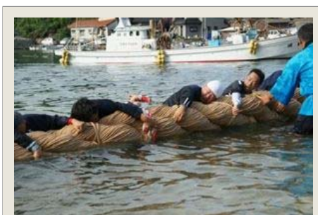
400年以上の歴史を誇る伝統行事「海中盆綱引き」

毎年8月15日に行われる唐津市鎮西町波戸の『海中盆綱引き』は、400年以上の歴史を誇る伝統行事です。