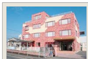
福岡県筑紫郡那珂川町にある 株式会社HRK本社社屋