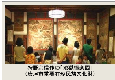
狩野宗信作の「地獄極楽図」 (唐津市重要有形民族文化財)

唐津市弓鷹町にある「浄泰寺」は、別名「えんま寺」とも呼ばれており、地獄の釜があくといわれる8月16日には、「閻魔堂」内部とともに、延宝5年(1677)狩野宗信作の「地獄極楽図」(唐津市重要有形民族文化財)が公開されます。