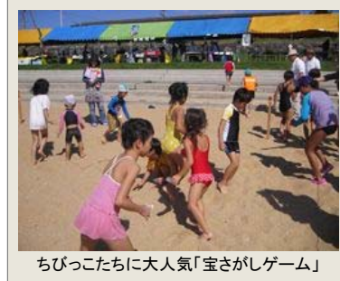
ちびっこたちに大人気「宝さがしゲーム」

今年もまた、唐津ではたくさんの海に関連したイベントが毎週のように行われておりますが、たくさん遊んだ人も、まだまだ遊び足りない人も、ぜひチェックして頂きたいのが、玄海国定公