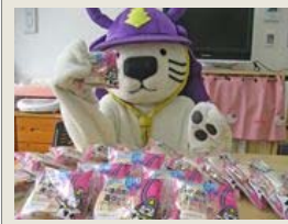
唐ワンくんデザインのパンが販売