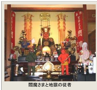
閻魔さまと地獄の従者