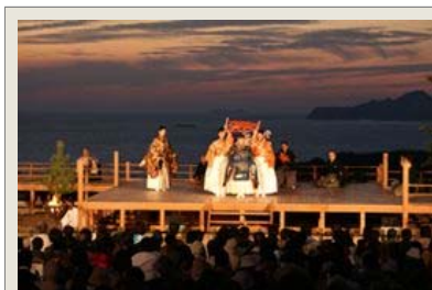
名護屋城跡の本丸跡に特設舞台を設け、薪の炎に照らしたされる幽玄の世界