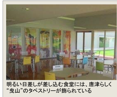
明るい日差しが差し込む食堂には、唐津らしく “曳山”のタペストリーが飾られている