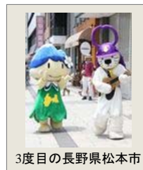
3度目の長野県松本市