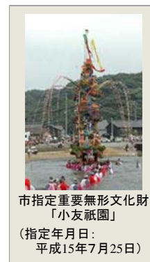
市指定重要無形文化財 「小友祇園」

小友祇園は、八坂神社の祭事として毎年旧暦の6月14日、15日に行なわれています。万治元年(1658年)にコレラが流行した際に、悪疫退散を祈願して始まったといわれており、平成15年7月25日に唐津市の重要無形文化財に指定されています。