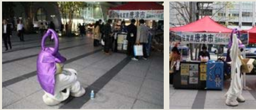
東京駅をご利用される皆様、唐津の唐ワンくんがいますよ