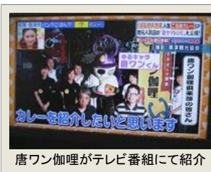
唐ワン咖喱がテレビ番組にて紹介