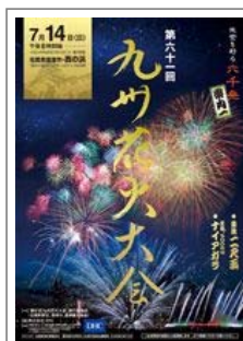
第61回九州花火大会 平成25年7月14日(日) 詳細…(PDF)