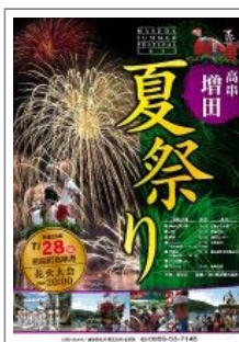
増田神社夏祭り 平成25年7月28日(日) 詳細…(PDF)