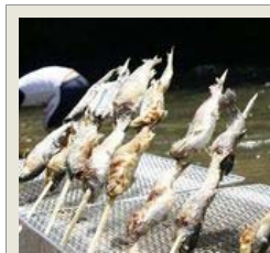
アユとヤマメの塩焼きに舌鼓