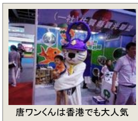
唐ワンくんは香港でも大人気

夏の暑さにはカレーがいいそうです。唐津のご当地グルメとして定着してきた「唐ワン咖喱」 がテレビ番組で紹介されました。唐津産の食材と唐津産のお米で作る店舗ごとオリジナルの カレー「唐ワン咖喱」が評判を呼んでいます。唐津でしか食すことができない唐ワン咖喱を是非 一度ご賞味ください。