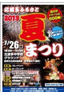
北波多ふるさと夏まつり 平成25年7月26日(金) 詳細…(PDF)