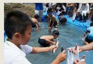
アユのつかみ取りやアユ釣りなど、楽しいイベントも盛りだくさんです。