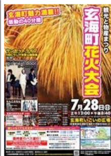
観光と物産まつり 玄海町花火大会 平成25年7月28日(日) 詳細・・・(PDF)