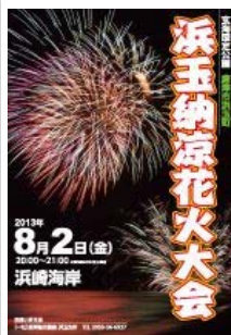
浜玉納涼花火大会 平成25年8月2日(金) 詳細・・・(PDF)