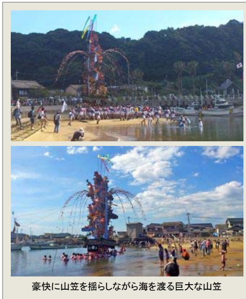
豪快に山笠を揺らしながら海を渡る巨大な山笠

唐津市呼子町の八坂神社の夏祭り「小友祇園」が、7月21日(日)22日(月)に開催されます。