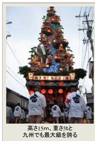
高さ15m、重さ5tと九州でも最大級を誇る

唐津市浜玉町の諏訪神社の夏祭り「浜崎祇園祭」が、7月20日(土)21日(日)に開催されます。「浜崎祇園祭」は、諏訪神社境内に祀られている祇園社の祭礼で、平成14年5月10日に唐津市の重要無形文化財に指定されています。