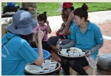
1枚のチケットで、5つの店舗のカレーがいただけます