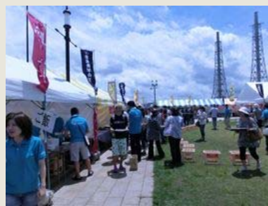
小さなお子さまから大人まで、夏の一日を楽しめる「第2回カレーの王者決定戦 2013」

昨年の夏に開催され、1,400食が完売し好評を博した「カレーの王者決定戦」が、今年も8月4日(日)に唐津東港(唐津市東大島町フェリーターミナル横広場)で開催されます。唐津市を中心とした佐賀県内のカレー店舗15店が出店し、お客様の投票により“カレーの王者”を決定します。