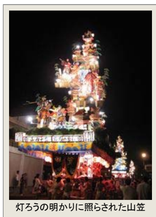
灯ろうの明かりに照らされた山笠