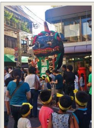
昨年の「からつ土曜夜市」で初お目見えした「黒獅子」も登場