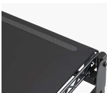
すべり止めシート 商品運搬時も安心。