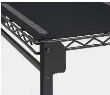
指挟み防止機構 開閉動作時の指挟みを防止。