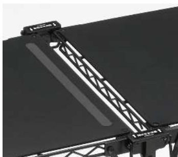
展開時も安全 天板中央部を開けているので ID カード等が挟まりません。