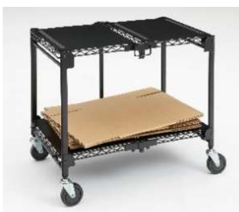
片側支柱構造 支柱は片側だけなので、下段への 段ボールのストックに便利。