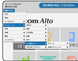
オスコムアルト操作画面