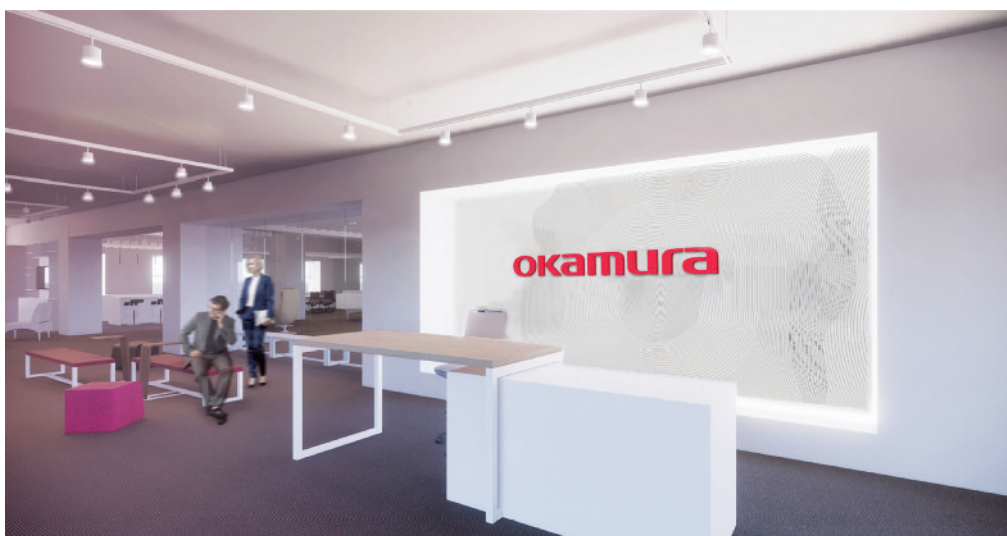
オカムラ シカゴショールーム エントランスイメージ

「NeoCon 2019」では、新製品としてソファシステムとカンファレンスシーティングを展示します。ワーカーのパフォーマンスと快適性が向上するオフィス家具や働く空間を提案し、グローバル企業としての価値向上に努めます。