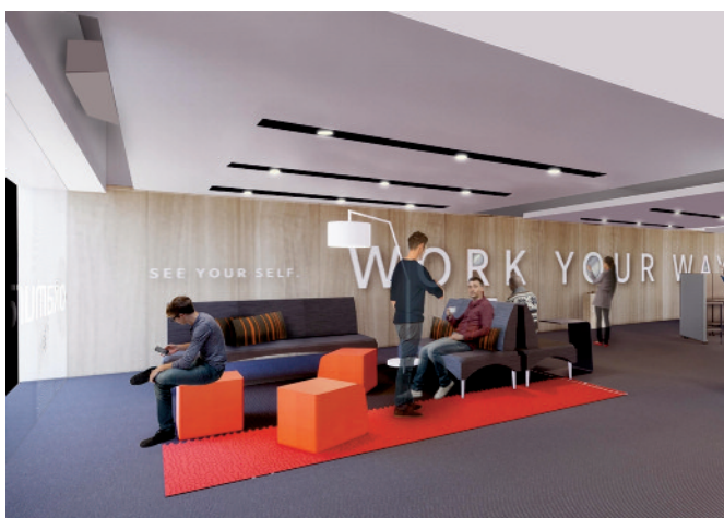
オカムラ シカゴショールーム イメージ