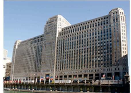
Merchandise Mart Plaza (Chicago)

名 称：株式会社オカムラ シカゴ支店・シカゴショールーム 所 在 地：222 Merchandise Mart Plaza, Suite 1100, Chicago, IL 60654, U.S.A. 面 積：1061 m 2 (うちショールーム 958 m 2 ) 設 計：Perkins+Will