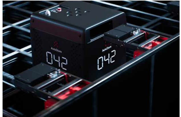
バッテリーパックステーションにてバッテリーを自動交換