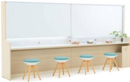
大人数で使える鏡台

最大幅 5400 mmまで連結でき、連結部に足元を邪魔する脚がないため、大人数でも使いやすい鏡台です。照明がついたタイプやコンセント、トラッシュユニットなど、オプションも充実しており、心地よい Dressing Space の主役となります。