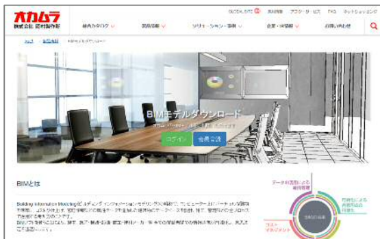
オカムラウェブサイト「BIMモデルダウンロードサイト」 トップページ

オカムラはオフィスシーティングやデスク、テーブル、パーティションなどの主要製品のBIMモデル約80点を「BIMモデルダウンロードサイト」へ公開します。オカムラ製品のBIMモデルを設計や構造、施工を担当する関係者間で活用いただくことで、情報や空間イメージの共有ができ、什器計画における意思決定を迅速にします。関係者の方々のより良い提案に役立つよう、今後も製品ラインアップを増やし、順次公開します。