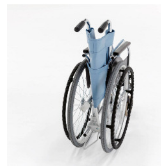
金具を取り付けた状態で車椅子を折りたたむこともできます

※「divo コネクター」は、安全にお使いいただくために、対応車椅子に対する条件がございます。 詳しくは単品カタログをご覧ください。