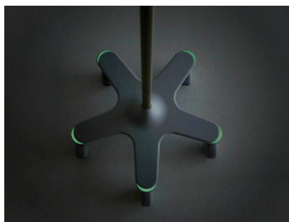
三日月型の蓄光パーツが付いたベース部分

ベースの5本脚の部分に、蓄光パーツを付けました。日中の蛍光灯下500lx(ルクス)以上で1時間以上の蓄光をすることで、夜間の消灯時にベッドサイドでほのかに光を放ちます。トイレなどでベッドから立ち上がる際に点滴スタンドの位置を知らせ、転倒などを防ぎます。暗闇でも患者の安全を守ることができます。キャスターにはキャスターカバーが付きました。こぼれた輸液のしずくが直接車輪に付くことを防ぎ、清掃性を高めました。髪の毛や埃を巻き込んで、車輪が回らなくなるなどの心配の少ない車輪を採用しました。