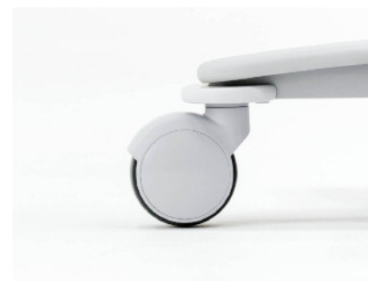
キャスターがスムーズに動く、キャスターカバー