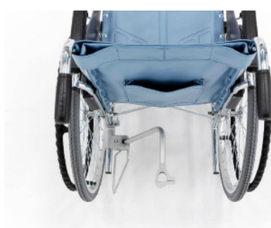
コネクター使用状態