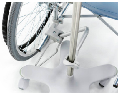
「divo lua」を取り付けた状態

介助者が両手で安全に車椅子を押せるよう、点滴スタンドをワンタッチで車椅子に連結できる、「divo」専用コネクター。進行方向を妨げず、介助者に近い車椅子の背後中央部に点滴スタンドを連結できます。金具は折りたたみが可能なので、使わないときも取り外す必要がありません。