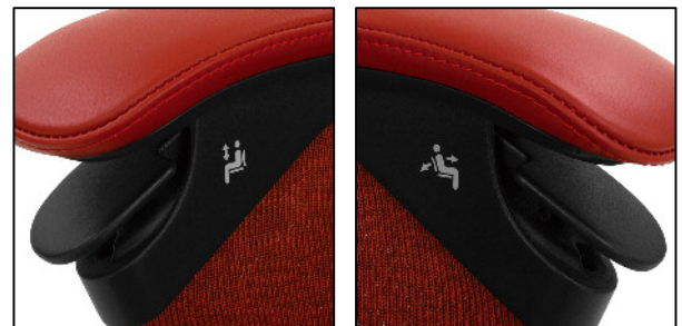
いすの上下調節レバー

肘の先端に装着された操作レバーにより、座面の高さとしりぞきの角度を調節できます。