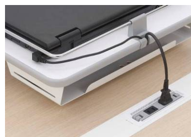
コンセントユニットを用いた充電

また、ナースカートが当たったときの静音対策として、緩衝材（当たり止め）を標準装備しています。T字型の脚をまたがせてナースカートを格納することが可能で、カートの台数が増えた場合でもカートピットの増設は不要です。