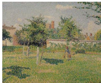
「垣柵の女、エラニーの小さな牧場に降る春の陽光」