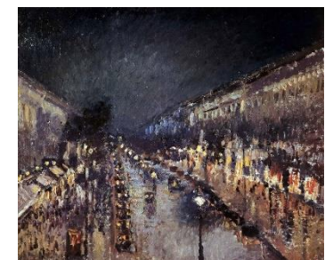
「夜のモンマルトル大通り」