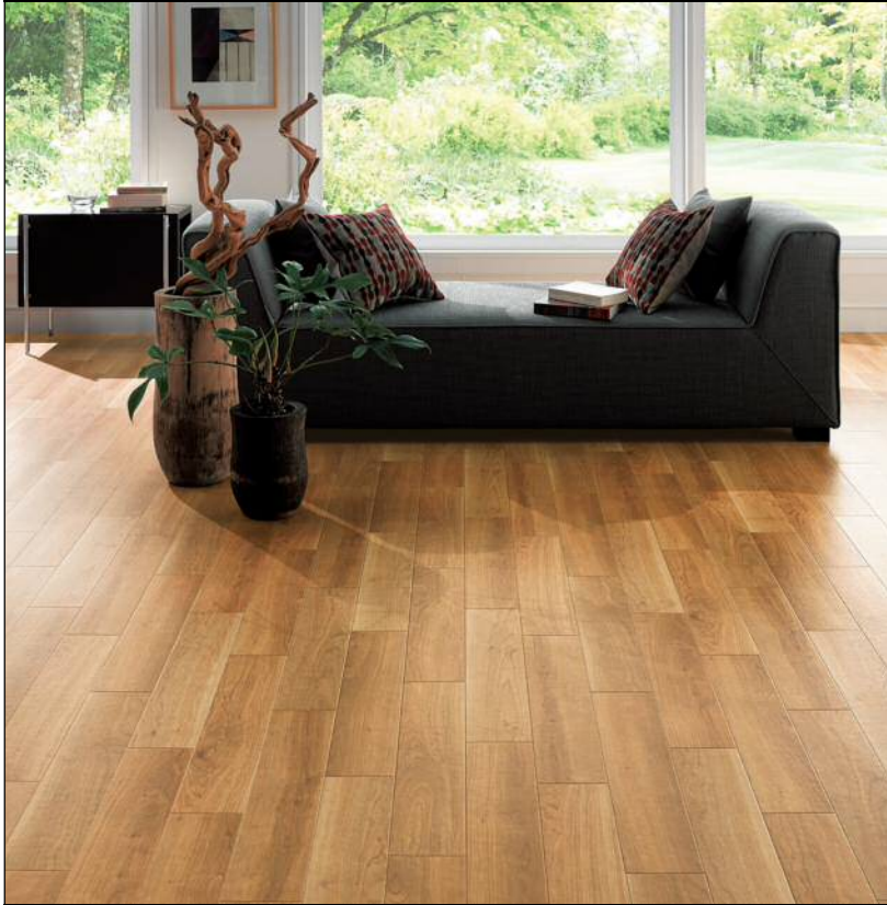
天然木ブラックチェリーの 美しさを再現した HM-2001 の施工例