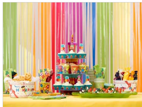
おとな&キッズパーティ

このほか、こだわりのブランドの“特選ショップ”など、人気のブランドショップの商品と日用品と一緒に購入できるのが LOHACO の魅力のひとつです。