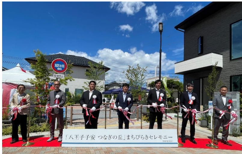
「まちびらきセレモニー」のテープカットの様子

そしてこのたび、モデル街区が完成し、2026年5月9日に「まちびらきセレモニー」を開催しました。