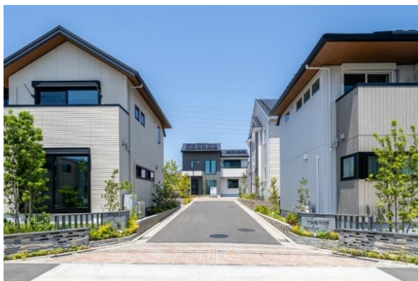
「八王子 子安 つなぎの丘」

なお、提案書の企画段階から実施については、市内事業者とのコーディネーターとして住宅生産振興財団とデザイナーの UK 合同会社が連携を行い、事業の円滑な実現に寄与しています。