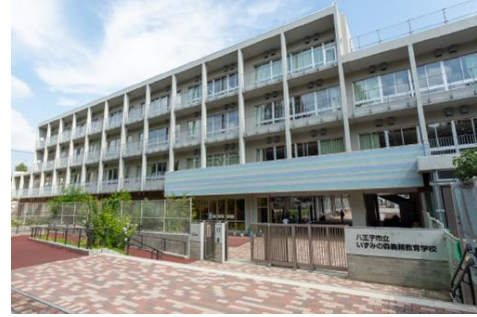
小中一貫校「いずみの森義務教育学校」