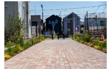
歩行者専用道路の植栽帯