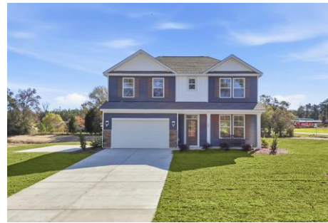
【ユナイテッド・ホームズ社の戸建住宅商品】

大和ハウスグループは、海外事業をより成長させるために、米国における戸建住宅事業を拡大しています。米国は地域ごとに住宅市場の特性が異なることから、当社グループでは、戸建住宅事業を手がけるスタンレー・マーチン社、キャッスルロック社、トゥルーマーク社の3社が、それぞれの地域で実績を有する住宅会社の事業譲受や株式取得などを通じて、供給エリアの拡大と事業基盤の強化を進めています。